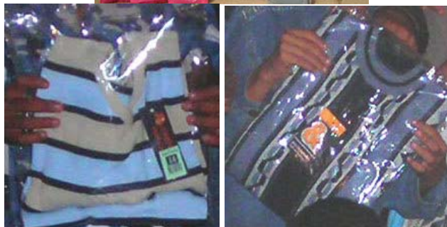
Photos des vêtements achetés