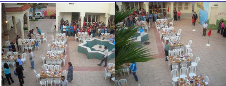
Photos du Ftour organisé